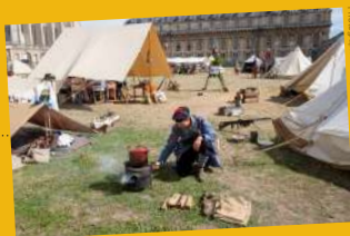
Illustration : Jean-François