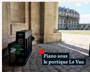
Piano sous le portique Le Vau