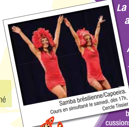
Samba brésilienne/Capoeira. Cours en simultané le samedi, dès 17h, Cercle Tissier